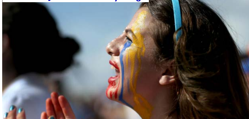
Protesta de venezolanos en Miami

fueron están adquiriendo valiosos conocimientos que luego servirán para reconstruir una nueva Venezuela.