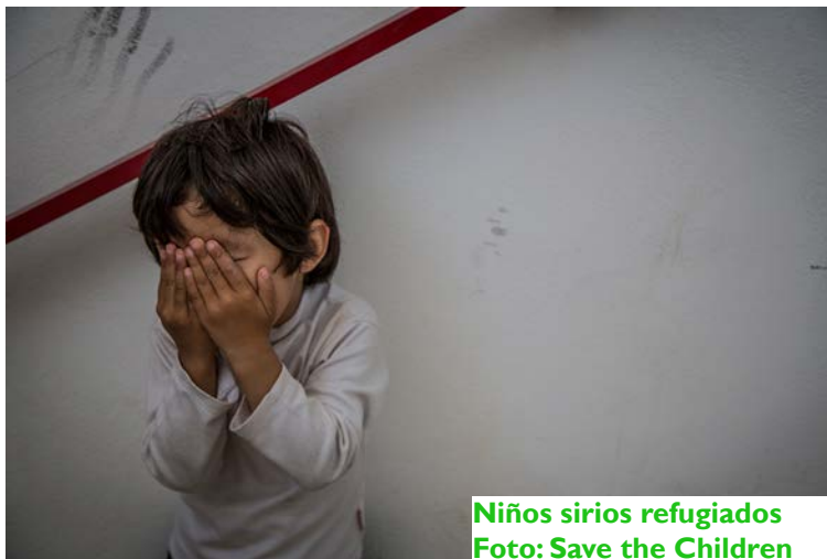
Niños sirios refugiados

Paso a paso, verso a verso, gota a gota, miles de huellas infantiles –por tierra y por mar– han ido creando la nueva ruta del dolor infantil. Durante 2015, 406.000 menores entraron en el continente de un total de 1,4 solicitantes (adultos incluidos) cuando estalló la crisis de refugiados. De ellos 96.000 niños solos pidieron asilo en Europa. Se desconoce la situación de muchos de esos niños, temiendo que una parte pueda haber caído en manos de bandas criminales. La Interpol alertó hace meses que 10.000 menores refugiados no acompañados habían desaparecido después de llegar a Europa. Eso no significa que hayan caído en manos de mafias, pero el riesgo existe.