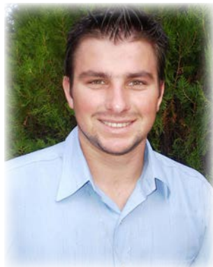
Por: Andrei Zanon, c.s.