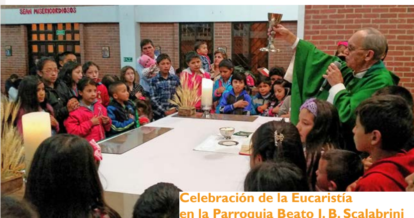
Celebración de la Eucaristía en la Parroquia Beato J. B. Scalabrini

¿Cómo actúan la lógica y la equidad, nos preguntamos, si hoy que el territorio colombiano se ha convertido en corredor migratorio, la única respuesta por parte de las autoridades es la deportación de quienes son detenidos sin documentos en regla? En momentos así, sería importante, ante todo, considerar la cifra de colombianos residentes en el exterior y, luego, hacer memoria de cuántas veces el gobierno colombiano ha abogado para evitar las deportaciones de sus ciudadanos desde los países vecinos.