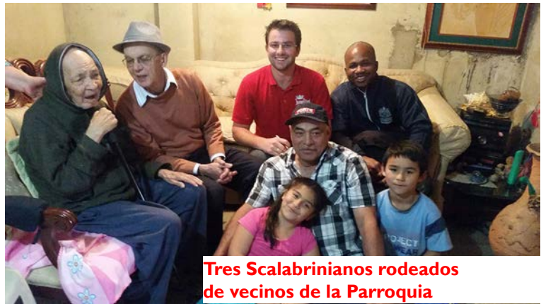
Tres Scalabrinianos rodeados de vecinos de la Parroquia

Son muchos los afligidos en la parroquia, sea por situaciones familiares, económicas, laborales, educativas o de salud; la alegría, siempre destacada entre la fidelidad y sencillez de los pobres y humildes, es constante en los fieles parroquianos, haciendo de la parroquia una comunidad alegre en la Fe. Es muy evidente la dedicación al prójimo caracterizada por el gran respeto, apertura, cariño y acogida; desde los niños hasta los más ancianitos hacen de esta parroquia un ambiente familiar y acogedor, tal como se espera de toda Comunidad Scalabriniana.