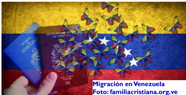
Migración en Venezuela

“Reuters / ...Envalentonados por los menos de 30 km que los separan de esas costas (de las islas caribeñas -nr-), cada vez más venezolanos que huyen de la crisis económica