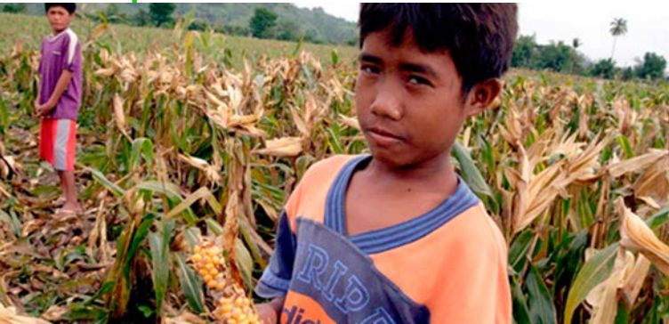
Refugiados Climáticos

El término refugiado ambiental o climático es, en realidad, legalmente incorrecto. Un refugiado como tal es alguien que tiene “temores fundados de ser perseguido por razones de raza, religión, nacionalidad, o pertenencia a un grupo social en particular o a una opinión política, y que está fuera del país de su nacionalidad”.