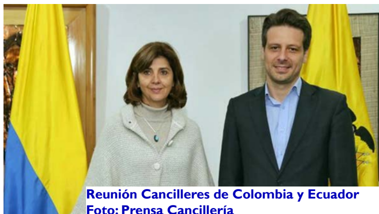
Reunión Cancilleres de Colombia y Ecuador

“No perseguimos personas, perseguimos delitos”