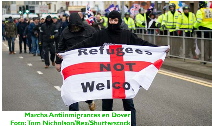
Marcha Antiinmigrantes en Dover

...Más de 6 mil casos de crímenes de odio se han registrado en el Reino Unido desde el pasado 16 de junio según datos de la organización Consejo de Jefes de la Policía Nacional (NPCC).