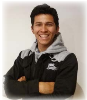
Por: Daniel Zerpa