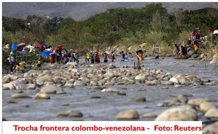
Trocha frontera colombo-venezolana

El bus salió de Barinas a las 6 de la mañana; en el camino conocí a 2 africanos que estaban nacionalizados en Venezuela, pero que iban a Cúcuta por la mala situación de mi país. Llegando a San Antonio del Táchira en un puesto de control del (CEICPC) nos hicieron bajar maletas para hacernos una requisita, debíamos entrar a un cuartico uno por uno; primero