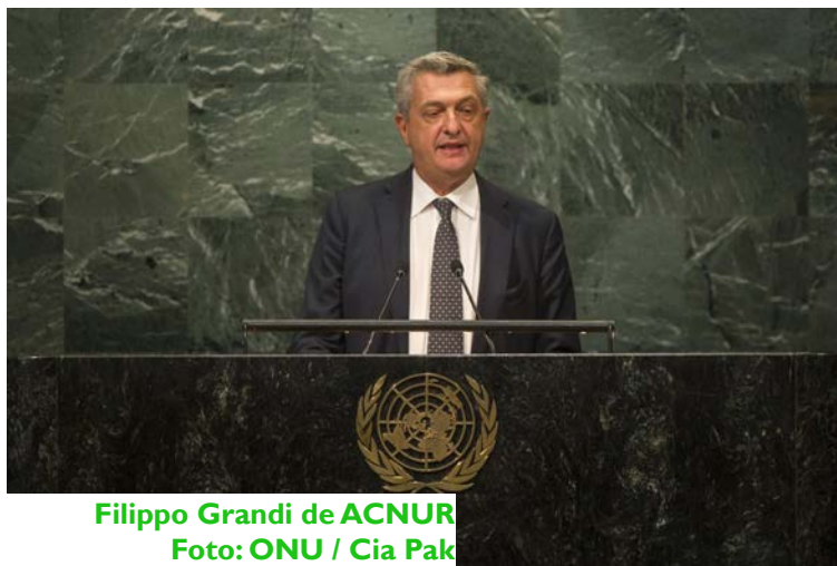
Filippo Grandi de ACNUR

“En situaciones de emergencia, en crisis prolongadas, en nuestra búsqueda de soluciones, ahora debemos desencadenar la participación de más sectores a través de acuerdos predecibles y cooperativos activados antes de que se desate la crisis”, dijo el jefe de ACNUR.