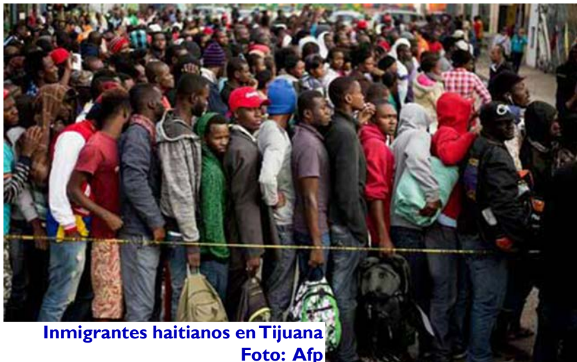
Inmigrantes haitianos en Tijuana

“SAN JUAN – ...En un comunicado, las autoridades locales detallaron que durante un ejercicio rutinario agentes de vigilancia avistaron un barco a 112 kilómetros de Inagua (al sur del archipiélago de Bahamas -nr-), por lo que procedieron a su inspección, durante la que fueron descubiertos 96 hombres, 17 mujeres y 4 menores.