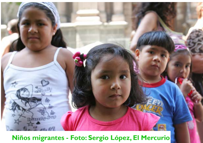
Niños migrantes

“Aldeas Infantiles SOS instará hoy al cese de las detenciones de niños refugiados y migrantes durante la primera cumbre a nivel de Jefes de Estado y de Gobierno convocada por la Asamblea General de Naciones Unidas, en su sede de Nueva York, para analizar los grandes desplazamientos de refugiados y migrantes, y elaborar un plan de respuesta internacional más humanitaria y coordinada.