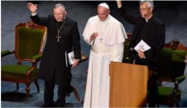
el Papa en Lund

Lund es una pequeña ciudad (82 mil habitantes) de Suecia , con mil años de historia. Allí se inauguró con la presencia del Papa, el 31 de octubre pasado, la solemne conmemoración de los 500 años de la Reforma Protestante cuando el monje Martín Luther el 31 de octubre de 1517 proclamó 95 tesis teológicas para la reforma de la Iglesia, en Wittemberg (Alemania). Los actos conmemorativos se realizaron en Lund porque la Federación Luterana Mundial nació en esa ciudad en 1947; ahora tiene sede en Ginebra (Suiza), agrupa a unas 145 iglesias, representando a 72 millones de fieles en 78 países. En Europa hay tan solo 36 millones; 21 millones hay en África. Los Luteranos son la primera Iglesia nacida de la reforma de Lutero. El movimiento Luterano dio origen a numerosas Iglesias, en particular a los Reformados y a los Anglicanos, bajo el denominador común de “protestantes”. En la actualidad hay 500 millones de personas en alguna de las distintas formas del protestantismo moderno.