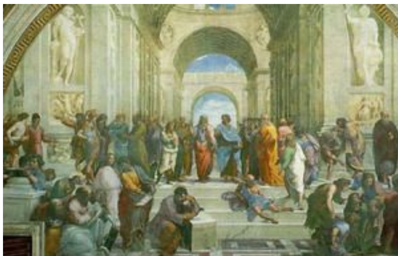
Escuela de Atenas

Sin embargo, las críticas al pensamiento utópico están también a la orden del día y echan raíces en la historia misma de las ideas. Ya La República de Platón, como nos lo recuerda Eugenio Imaz (Imaz, 1941: 35) contaba entre sus contemporáneos con críticos como Aristóteles, quien ponía su acento en la irrealizabilidad de ciertos ideales de su ciudad, como es el caso de la comunidad de bienes. Pero será más adelante, con Marx y Engels, que el término utópico será utilizado de manera despectiva, ya no solo de manera diferenciadora. Es así que se establecen los límites entre quienes -como ellos- habrían descubierto las “bases científicas de la estructura económica de la sociedad burguesa” y aquellas tendencias que aún persistentes en la Liga de los Justos (aunque lógicamente menos presentes cuando pasa a denominarse Liga Comunista) -siempre según los autores del Manifiesto-, no habían logrado comprender esas bases científicas fundamentales para hacer del proyecto comunista algo más que una mera especulación o un mero socialismo de corte burgués. De esta manera, como señala Buber, estaban echadas las bases de la pugna: “Desde entonces, el calificativo de ‘utopista’ pasó a ser el arma más fuerte en la lucha del marxismo contra el socialismo no marxista” (Buber, 1987: 15).