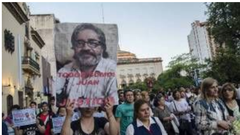
El tráfico y la producción de cocaína