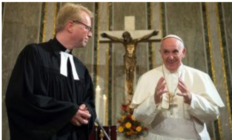
Francisco en Suecia