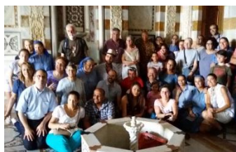
Encuentro del Equipo Internacional y del Mundo Árabe

Nº 96- Final del Centenario Diciembre 2016