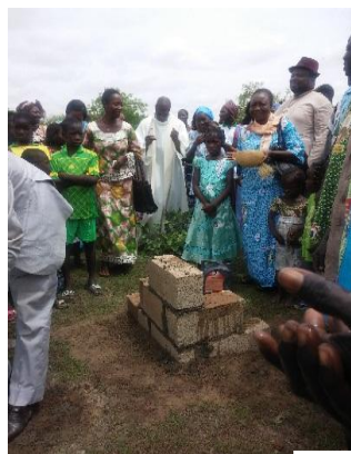
Oración conclusiva luego de la colocación de la primera piedra