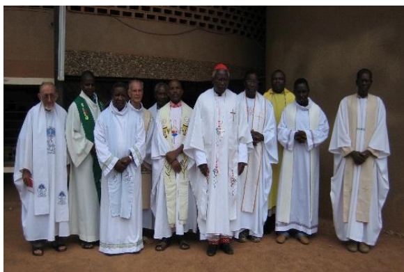
. A su regreso de las JMJ el Cardenal Felipe vino a celebrar la Eucaristía con los participantes. Esta es una imagen de los sacerdotes presentes con el cardenal.