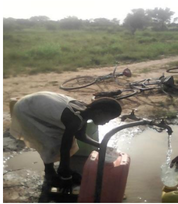
Niño del poblado cargando agua de la llave