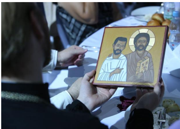
Icono rinde a la fraternidad de la Transfiguración

Pequeño guiño para mí: yo había vacilado un poco antes de emprender este viaje, pues bien en la catedral me he encontrado al lado de una mamá que llevaba dos gemelas discapacitadas en un cochecito....y en el momento de la comunión que nosotras no teníamos el derecho de tomar,