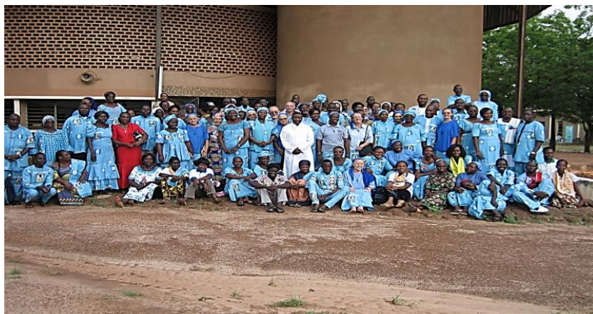
Conjunto de participantes vistiendo el pareo del centenario