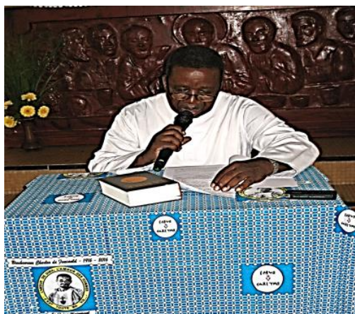
Sobre la mesa del predicador, el pareo confeccionado para el centenario. Se hizo con el propósito de dar a conocer al Beato hermano Carlos de Foucauld en todas las ocasiones en que sea utilizado. Se entrega información sobre la vida del BEATO a todas las personas que lo compran.