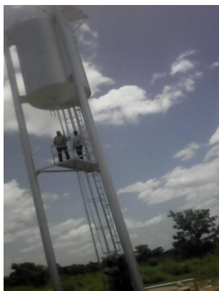
El tanque de agua regalado por un benefactor. Es el orgullo del poblado.