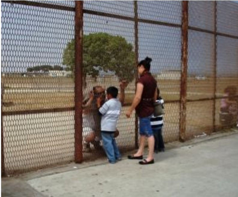
El obispo de Saltillo (Mexico) Raúl Vera