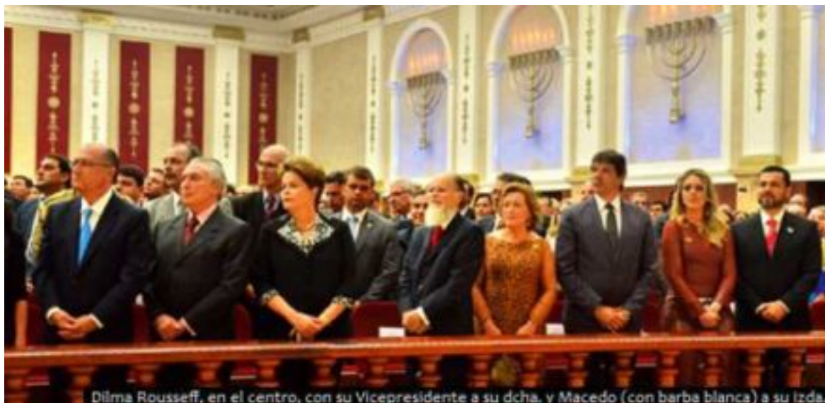
Inauguración del mayor templo brasileiro: Iglesia Universal (Temer, Dilma y Macedo).