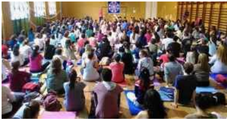
clase del "Proyecto Yoga y Meditación