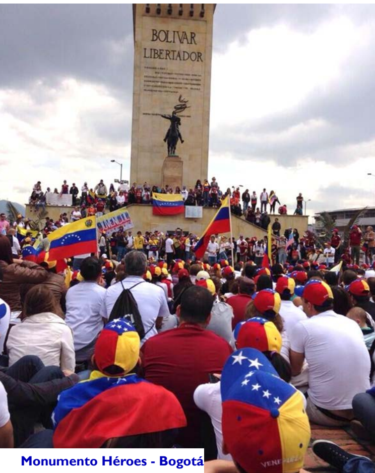
Monumento Héroes - Bogotá