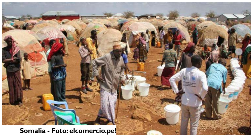
Somalia - Foto: elcomercio.pe!

Más de 12 millones de personas necesitan ayuda inmediata para sobrevivir