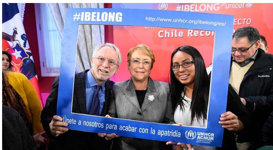
Michelle Bachelet.

en el marco de la Campaña Internacional “#IBelong”