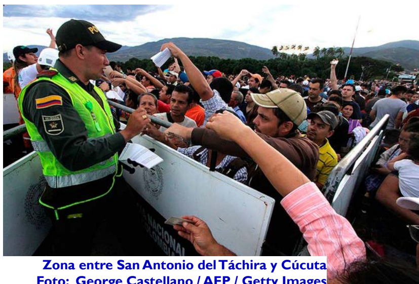
Zona entre San Antonio del Táchira y Cúcuta

Encuanto a las cifras, dijo que si bien no hay mucha información confiable, algunos datos preliminares encienden las alarmas: ‘En Colombia se habla de más de un millón de venezolanos. El caso del Caribe es desproporcionado: en Aruba, con una población