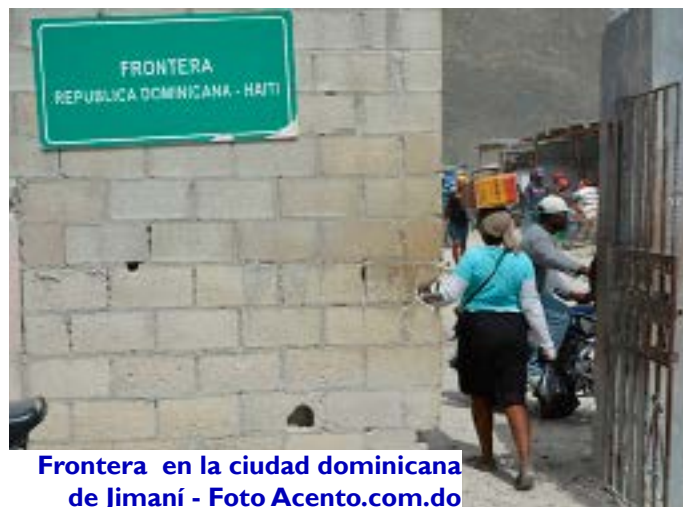
Frontera en la ciudad dominicana de Jimaní

“Trece mil 446 haitianos ilegales fueron deportados durante julio,