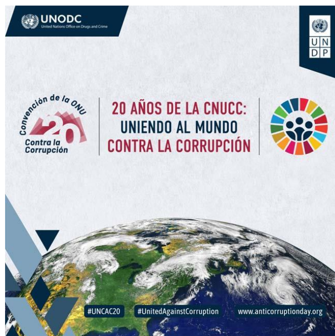
Cartel Día Internacional contra la corrupción 2023

El lema de 2023 ya se empezó a trabajar el año pasado y es: "A 20 años de la Convención de la ONU: uniendo al mundo contra la corrupción" .