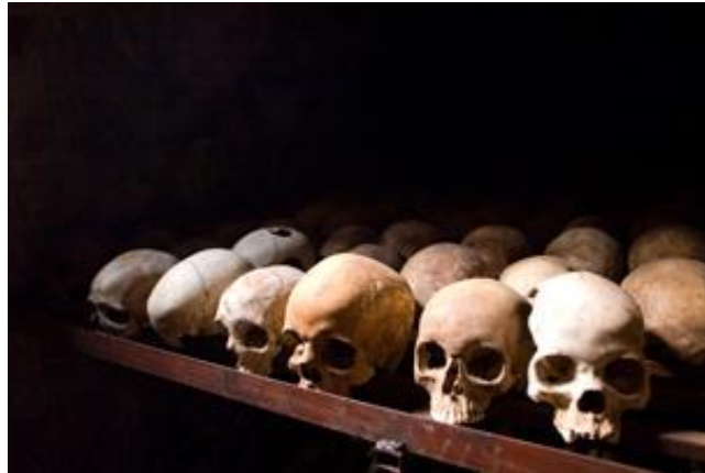
Calaveras en memoria de las víctimas del Genocidio de Ruanda.