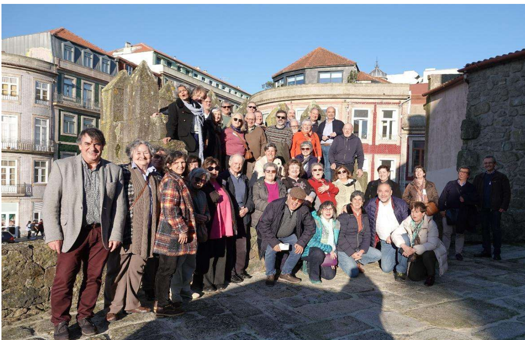
Participantes en el encuentro

Para San Agustín (354-430) una guerra podía considerarse justa si se conducía con dignidad, sin violencia innecesaria como respuesta de último recurso a la agresión y con el fin de obtener una paz justa. Describe una ley de guerra que define reglas para prevenir la violencia innecesaria o excesiva.