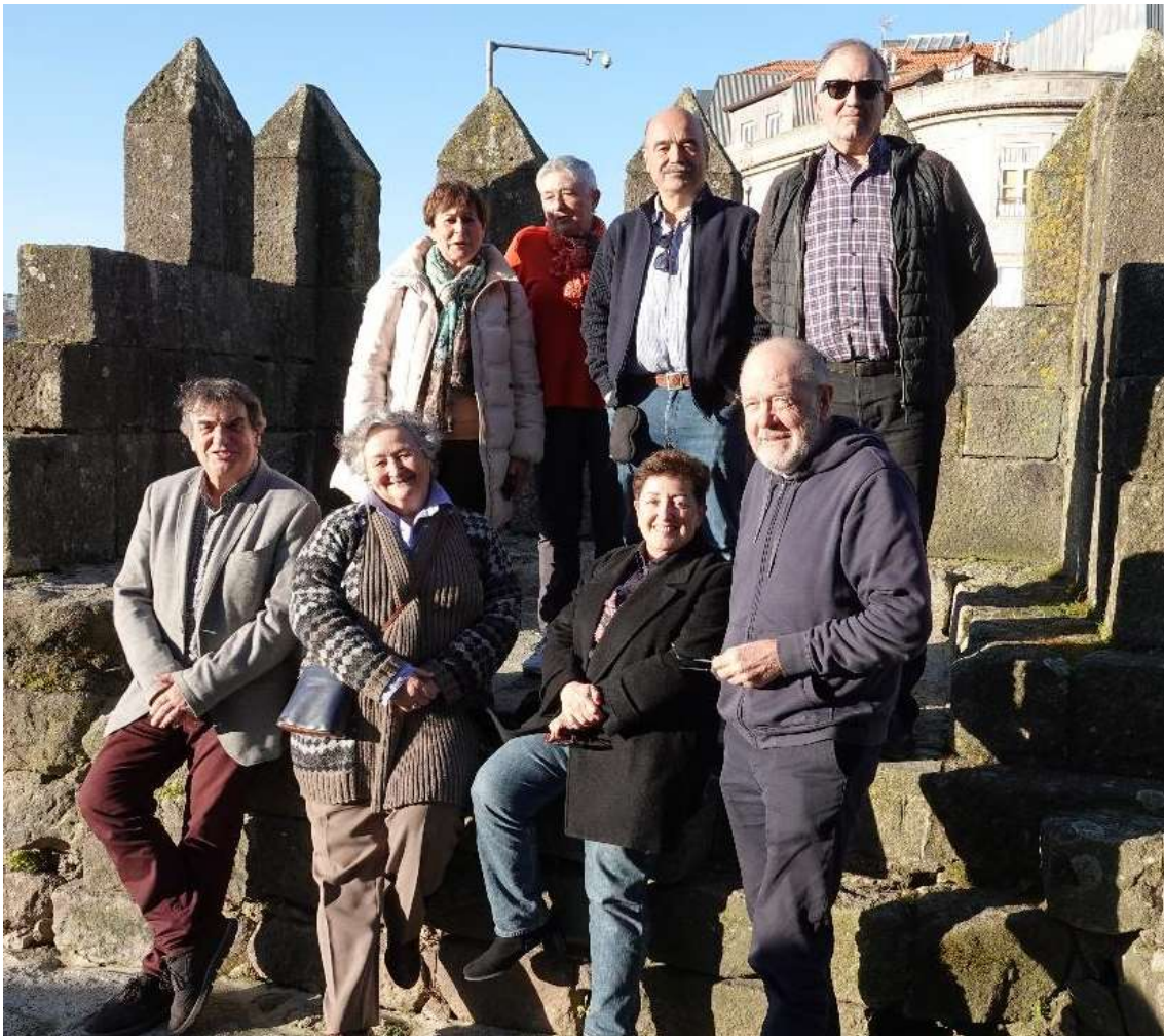
Representantes de Solasbide y BKA participantes en el encuentro

aplicación simplista de los principios de Darwin sobre la selección natural a las sociedades humanas, cayendo en el error de deducir reglas morales a partir de comportamientos instintivos, no mediados por la conciencia que distingue el bien del mal. Neus Forcano denuncia este pensamiento dominante: «El neoliberalismo se empeña en hacernos creer que la guerra es necesaria. Intenta por todos los medios que aceptemos, sin derecho a protestar, el uso de la fuerza, misiles y tanques. Nos damos cuenta de que los Estados occidentales no pueden mediar en los conflictos porque forman parte de los intereses que los provocan» , es decir, los beneficios de su industria armamentística.