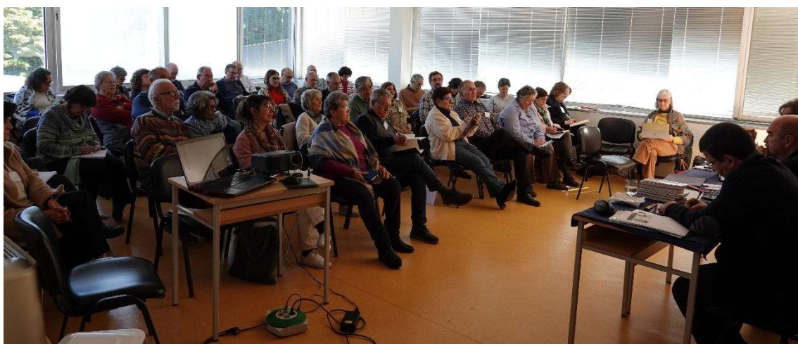
Participantes en el encuentro

cada cual desde sus circunstancias y responsabilidades, en todo caso alzando la voz y utilizando la palabra contra las armas.