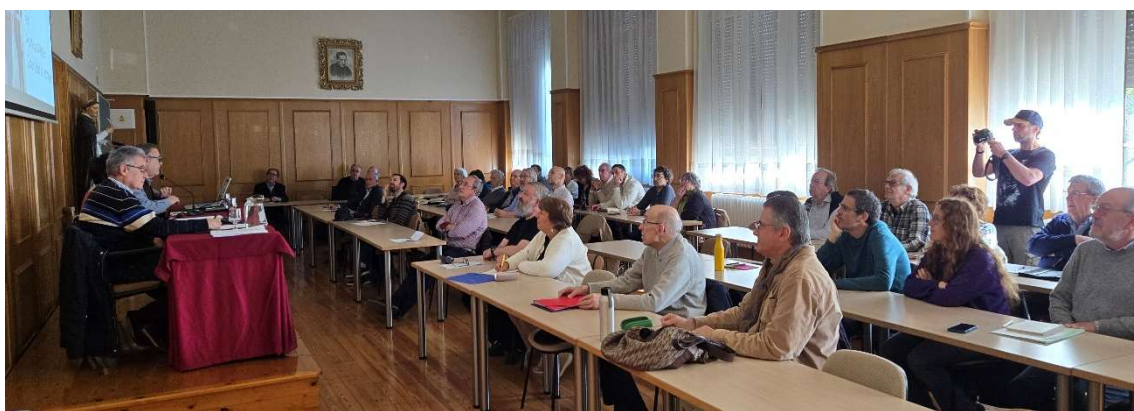
Participantes en el encuentro

Como viene haciendo desde ya hace una década, el pasado 24 de mayo Solasbide, grupo navarro del movimiento Pax Romana, celebró un encuentro abierto de debate, en esta ocasión con el tema “ Abrir caminos a la esperanza: repensar y renovar la política ”. Sintetizamos a continuación las principales reflexiones que compartieron los participantes.