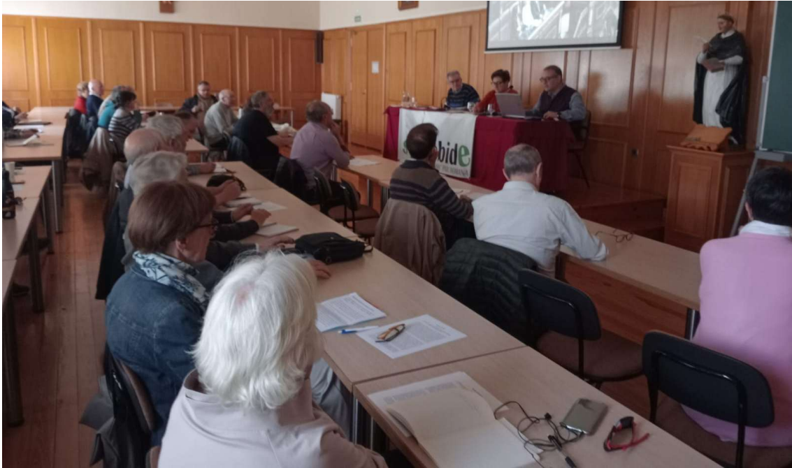
Participantes en el encuentro

Aunque con frecuencia no se vea, no se escuche, incluso se oculte en unos medios de comunicación controlados por los poderes económicos y que tienen su propia agenda, hay muchas personas trabajando por un mundo mejor, dentro y fuera de la política institucional, en su mayoría de forma anónima y humilde, pero efectiva. Hay muchísima gente en movimientos políticos y sociales, en oenegés, en el voluntariado, en las instituciones científicas, educativas, económicas, religiosas. Hay avances, hay muchos logros en las últimas décadas en materia de derechos humanos, aunque ahora tengamos la percepción de que se producen retrocesos. Hay ejemplos señeros de personas: se mencionaron los recientemente fallecidos papa Francisco y Pepe Mujica, alabados incluso por quienes actúan en sentido opuesto, que nos indican cómo cultivar la coherencia entre principios y modo de vida, la valentía en la denuncia de las injusticias, que nos enseñan la importancia, ante todo, de ser buenas personas y de hacer el bien en contra del individualismo y el egoísmo reinantes.