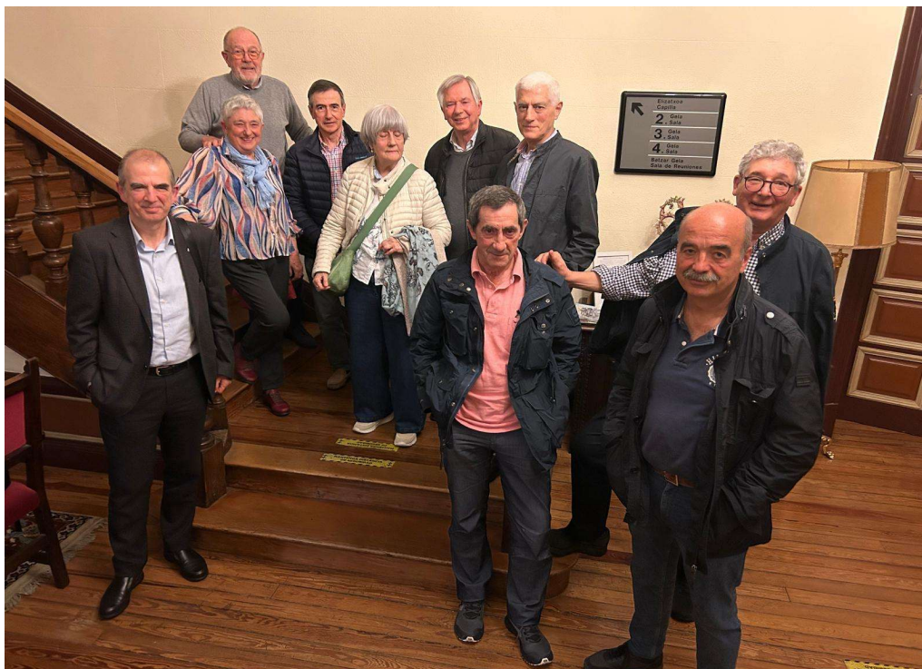
Participantes en la celebración de la Cuaresma