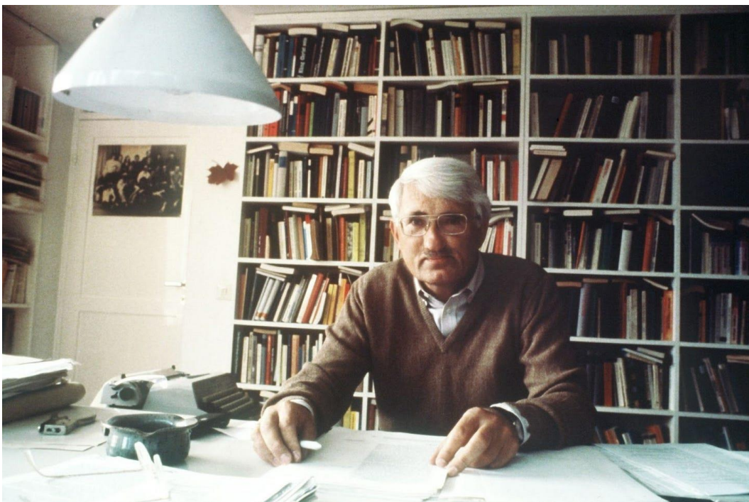
Jürgen Habermas en 1981.

Una de las peculiaridades de la publicación académica en inglés es que, a diferencia de las editoriales francesas y alemanas, e independientemente de lo esotérico del tema, las editoriales universitarias inglesas suelen incluir una ilustración en la portada de sus libros. Probablemente se trate de una convención, y no de una decisión comercial, ya que es difícil imaginar que mejore las ventas. En cualquier caso, esto suele poner a los filósofos en una situación incómoda cuando algún diseñador gráfico principiante les presiona para que respondan preguntas como "¿De qué trata su libro?".