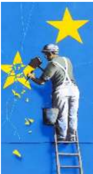
Parte do desaparecido mural de Banksy realizado en contra do Brexit en Dover

A complexidade dun proceso así é, por forza, complicada e lenta. Require de institucións políticas comúns orixinais e precisa dun prolongado tempo político para desenvolverlas. Por iso a UE é, aínda, un proxecto en construción, in fieri. Non obstante, os efectos sociais, económicos, políticos e culturais acadados son xa, hoxe, extraordinarios. De feito, malia os inevitables pasos adiante e atrás —como o brexit do Reino Unido, por exemplo— e as carencias ou deterioracións que tanto lamentamos e nos preocupan, a UE é, agora mesmo, a “rexión política” do mundo máis