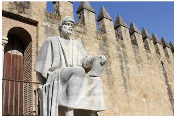
Monumento a Averroes en las murallas de Córdoba

Averroes, nacido en Córdoba en 1126 y fallecido en Marrakech en 1198, fue filósofo, jurista y médico. Sus comentarios a Aristóteles marcaron el desarrollo del pensamiento europeo y su defensa de la razón como vía de conocimiento sigue siendo una referencia en el diálogo entre filosofía y religión.