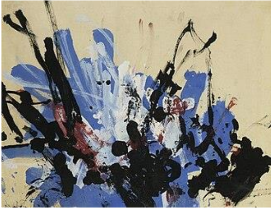
Pintura realizada por Congo, el chimpancé

En 1957 fue comisario de una exposición de pinturas y dibujos realizados por chimpancés en el Instituto de Artes Contemporáneas de Londres , que incluyó pinturas realizadas por un chimpancé joven, llamado Congo. Pablo Picasso aparece registrado como comprador de una de las obras de Congo y defendió públicamente tanto a Morris como a Congo de aquellos que sugirieron que el trabajo realizado por los chimpancés no era arte.